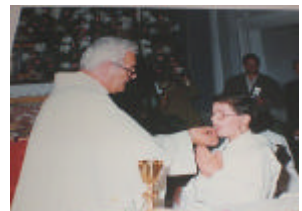
La prima comunione