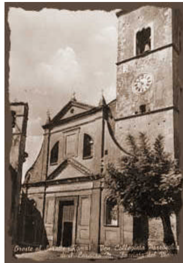
Chiesa parrocchiale di San Lorenzo Martire

Domenica 17 Gennaio 2010 ore 11,00 nella chiesa parrocchiale